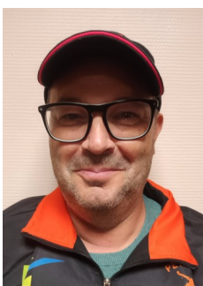
MEMBRE DU BUREAU :