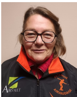
MEMBRE DU BUREAU :