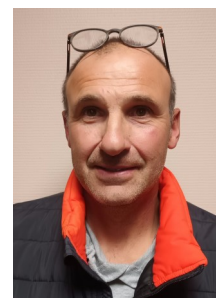
VICE TRESORIER :