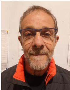
VICE PRESIDENT :