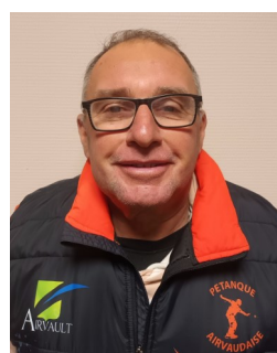
MEMBRE DU BUREAU :