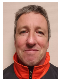
MEMBRE DU BUREAU :