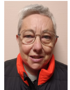
VICE SECRETAIRE :