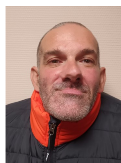
MEMBRE DU BUREAU :