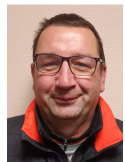
MEMBRE DU BUREAU :