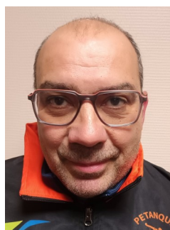
MEMBRE DU BUREAU :